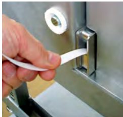
Snel wisselen van de band dankzij automatische invoer