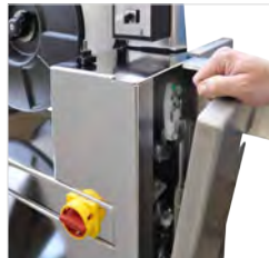
Makkelijk toegankelijk en gereedschapvrij onderhoud