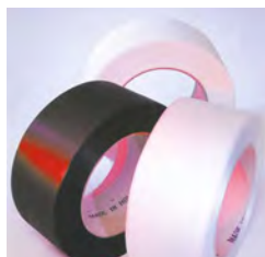
Smalle band voor goedkoper omsnoeren gebruik van dunne PP band