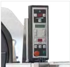
Eenvoudige bediening, wendbaar bedieningspaneel