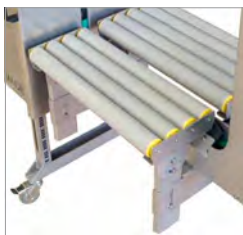
Opties Instelbaar naargelang de werkomgeving en - eisen

Machines, omsnoeringsband en service als totaalpakket