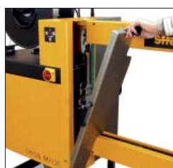
Accessibilità ottimale, manutenzione senza utensili