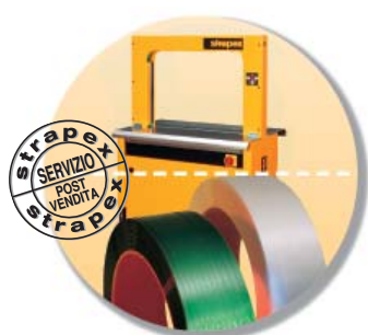
Macchina, reggia e servizio di assistenza come qualità globale