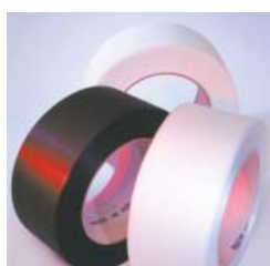
Reggie economiche per una reggiatura delicata grazie all'utilizzo di reggia sottile PP