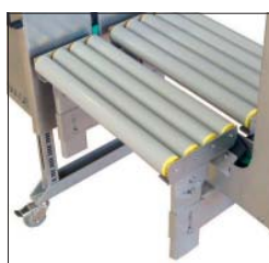
Opzioni Adattabilità ottimale su richieste dell'azienda o individuali