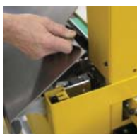
Minimaal onderhoud zonder gereedschap