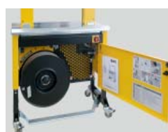
Robuuste, compacte constructie