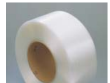
Economisch band voor zorgvuldige omsnoering