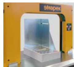
Pakket aanslag voor exakte positionering van losse pakketten