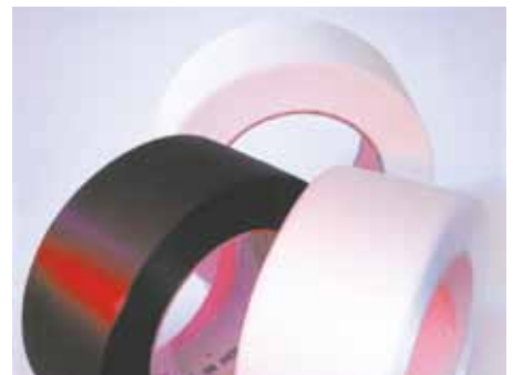
Gedrukt en specifieke band