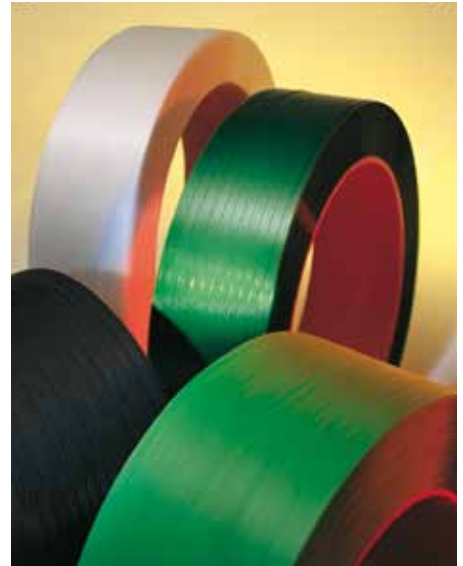
Polypropyleen (PP) + Polyester (PET)